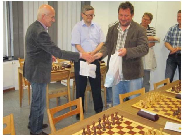
Ontmoeting in Hinsbeck

Er waren twee vriendschappelijke ontmoetingen met 'Schachgemeinschaft Nettetal', die zeer geslaagd mogen worden genoemd. De wedstrijd in Venlo werd een overwinning voor de gasten, waarna de ontmoeting in Hinsbeck met een Venlose zege werd afgesloten.