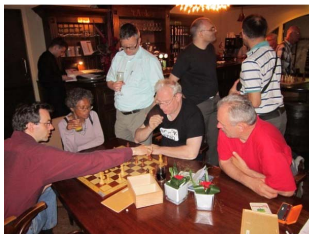
Analyse in het schaakcafé

Met in totaal 50 deelnemers was het toernooi goed bezet en kende ook een spannend verloop. We hopen jullie allemaal weer terug te zien op het Open Kampioenschap van 2013.