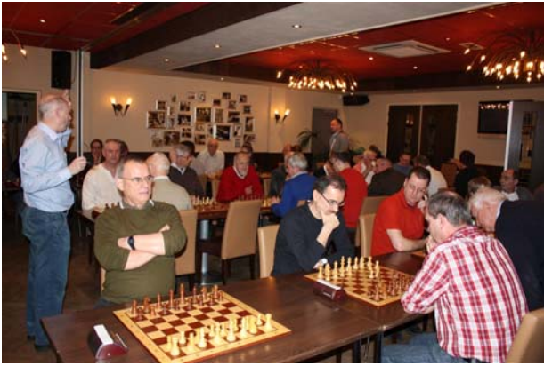
Overzicht van het Limianz Rapid 2012